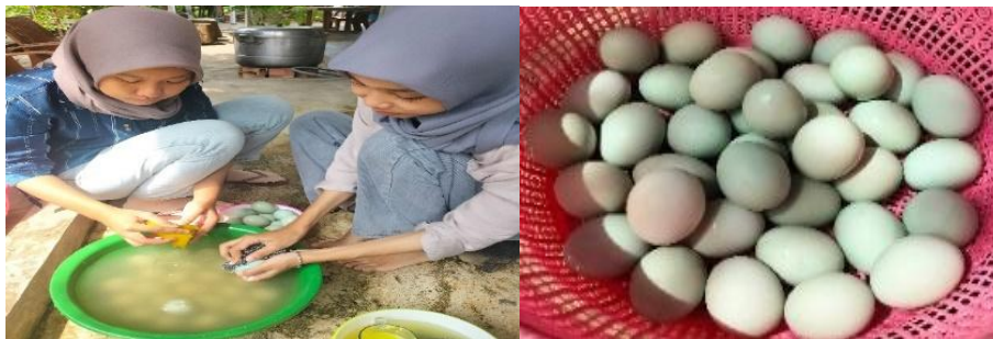
Gambar 15. Pembersihan kerabang telur itik

Proses pengasinan dapat menghilangkan bau amis, memberikan rasa yang lebih gurih dan tekstur yang lebih kenyal pada produk akhir telur asin. Hal ini diperkuat oleh pendapat Komala et al. (2022) yang menyatakan bahwa pengasinan menyebabkan telur itik menjadi tidak amis dan masa simpan telur lebih lama. Semakin lama waktu pengasinan akan semakin tahan lama masa simpan telur (Susilo, 2017). Proses pembuatan telur asin dicantumkan pada gambar berikut.