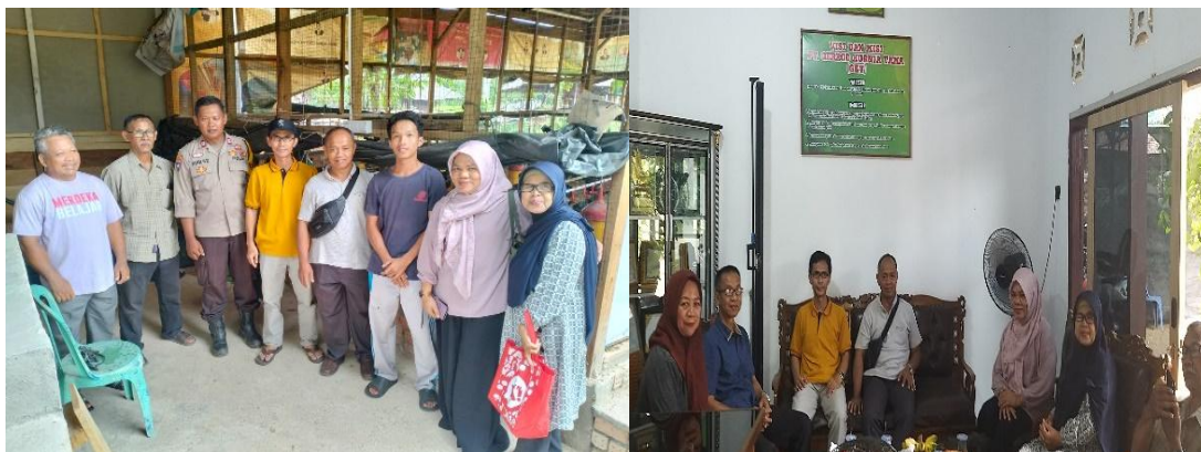
Gambar 2. Sosialisasi ke UMKM Serentak Regam Elok Batanghari

acara sosialisasi juga memfokuskan kembali ( refocusing ) program kegiatan supaya sesuai dengan permasalahan yang ada pada mitra.