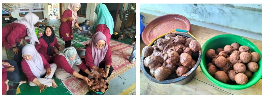
Gambar 8. Telur diperam selama 15 hari