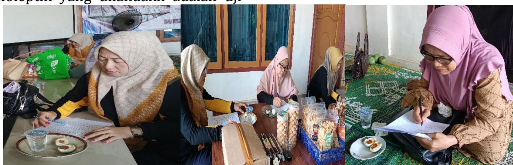
Gambar 9. Peserta pelatihan sedang melakukan uji organoleptic telur asin

kesukaan terhadap warna, aroma, tekstur, rasa dan penerimaan umun telur asin dengan media pengasinan yang ditambahkan ampas jahe merah.