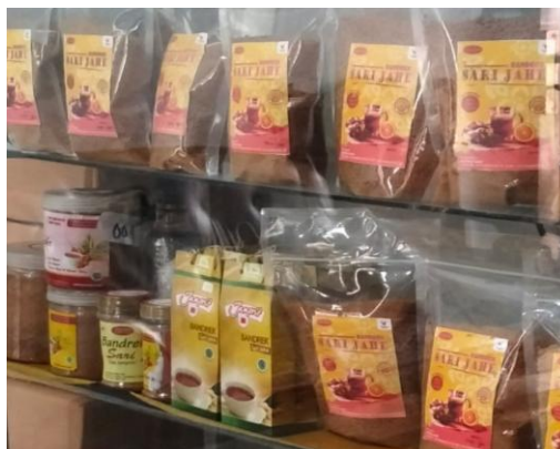
Gambar 4. Bandek jahe yang diproduksi oleh UMKM SRE

telah dilakukan oleh ibu Sri Suwarni adalah sebagai campuran dalam pembuatan kompos. Kompos ini dibuat untuk digunakan sendiri yang dicampur dengan daun-daunan, sisa limbah sayur, nasi dan limbah rumah tangga organik lainnya. Ampas jahe sisa pengolahan komoditas jahe mengandung senyawa bioaktif yaitu zingiberena yang berpotensi untuk dimanfaatkan sebagai produk fungsional (Cluddin, 2023).