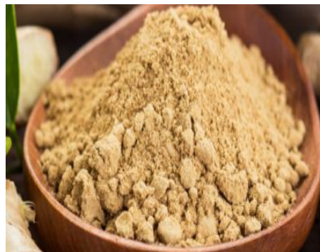
Gambar 6. Pembuatan media pengasinan dengan penambahan ampas jahe