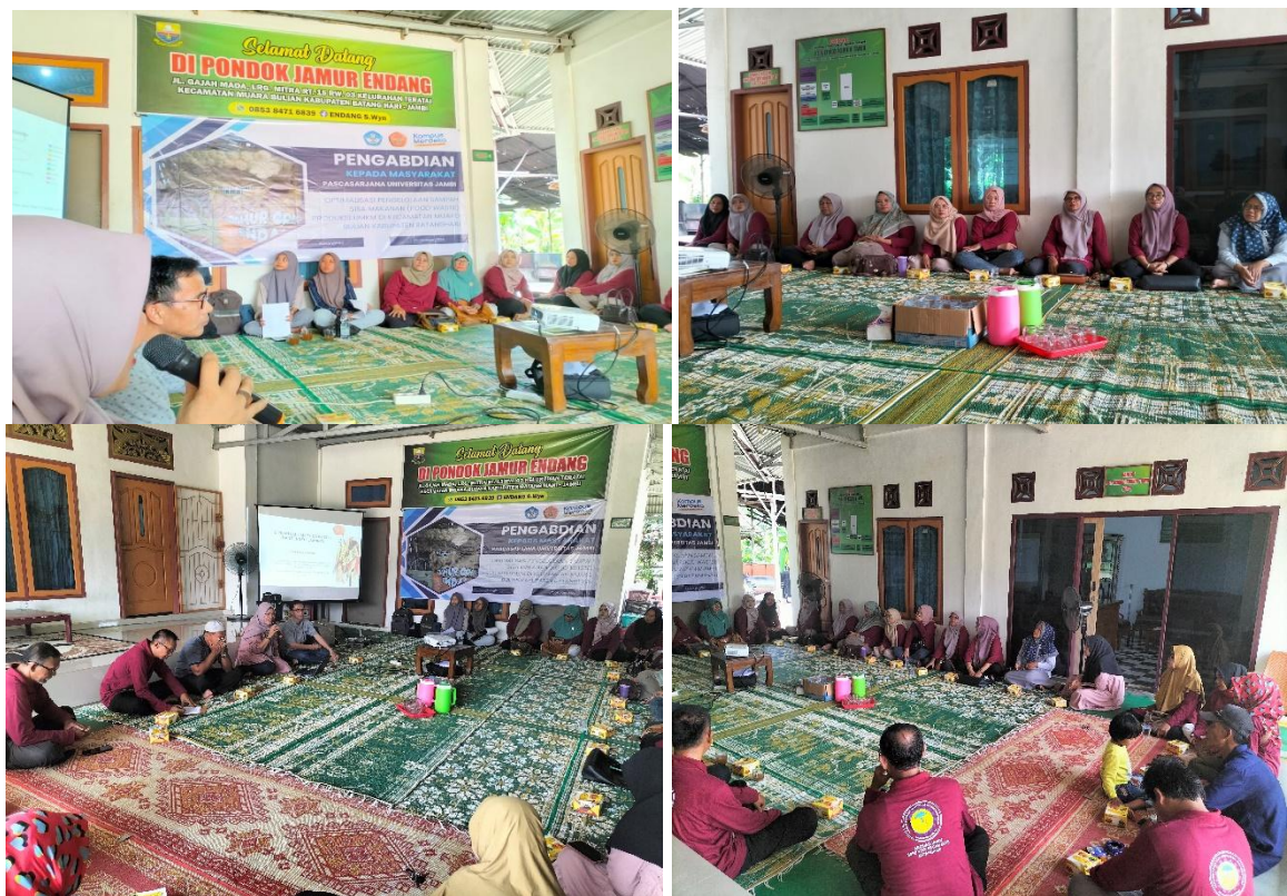
Gambar 3. Penyampaian materi tentang limbah