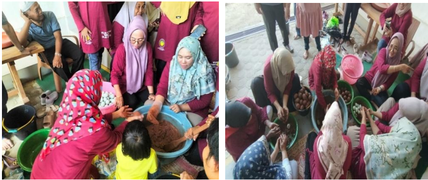
Gambar 7. Pembaluran telur dengan media