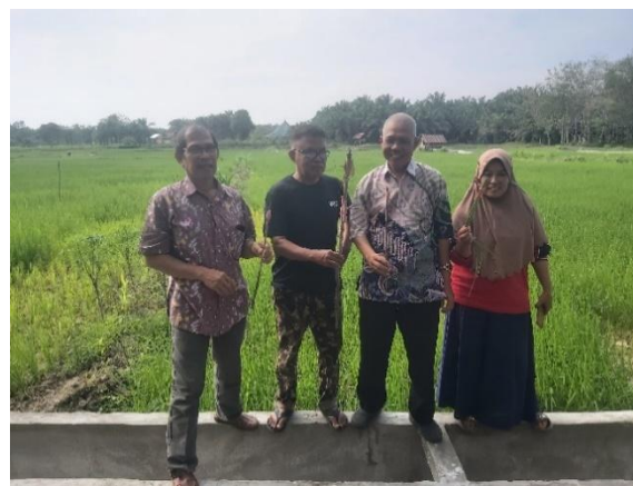
Gambar 1. Sawah yang dikelola oleh KWT Anggrek Desa Selat

Keong mas merupakan hama yang banyak meyerang tanaman padi. Hama ini menyerang mulai dari