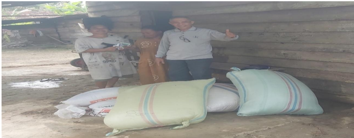
Gambar 6. Pakan yang distribusikan kepada KWT Anggrek

dan seluruh pakan telah diberikan kepada KWT Anggrek untuk dapat diberikan pada itik sesuai kebutuhan yang dianjurkan (gambar 6). Pemberian pakan didalam dan diluar kandang dapat dilihat gambar 7.