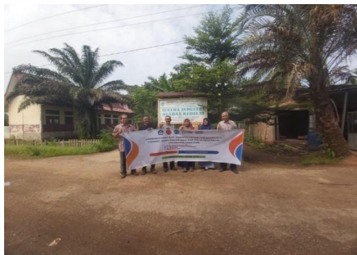
Gambar 3. Bersama Ketua KWT Anggrek

Pengabdian pada masyarakat dilaksanakan pada bulan Juli 2024 Kelompok Wanita Tani (KWT) Dusun Sungai Anak Desa Selat Kecamatan Pelayung Kabupaten Batang Hari. KWT Anggrek telah berusaha dalam kerajinan tahu tempe. Selain itu KWT juga mengolah lahan sawah untuk