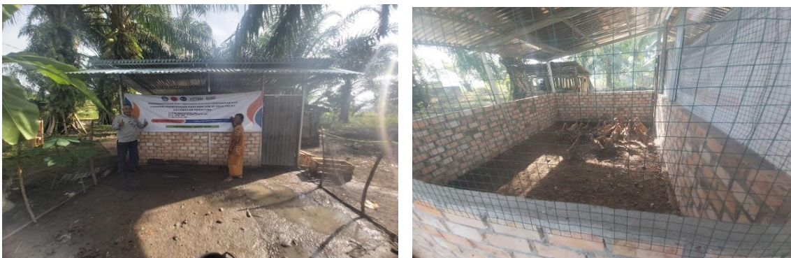
Gambar 5. Kandang Itik (3 x 4 M ) dan 30 Ekor Bebek

Untuk menambah pengetahuan cara meliharaan ternak itik, anggota KWT Anggrek telah diberikan pelatihan dan demonstrasi singkat cara budidaya itik. Salah satu pelatihan yang diterapkan adalah pembuatan kandang itik berukuran 3x4 meter dengan lahan umbar 3 x 4 meter (Gambar. 5)