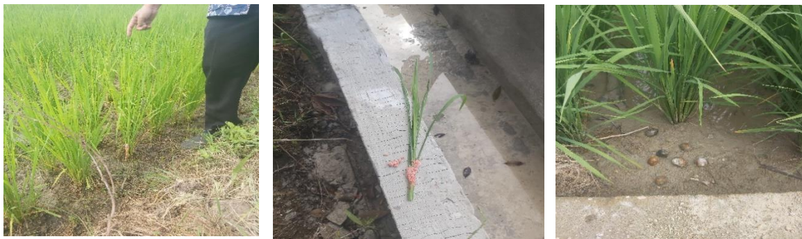
Gambar 2. Telur dan Keong Mas

padi (Gambar. 2). Berbagai upaya telah dilakukan oleh KWT Anggrek dalam menanggulangi serangan hama dengan menggunakan bahan kimiawi seperti; pestisida, namun hasilnya tetap tidak memuaskan. Penggunaan agrokimia dan pupuk secara intensif dapat menyebabkan pencemaran lingkungan (Melts, I. et al.2018). Berpotensi mengancam keamanan pangan dengan menurunnya ketersediaan lahan subur dan sumber daya seperti tanah bersih, air, dan makanan bebas kontaminasi (Carvalho, F.P. 2006; Carvalho, F.P. 2017).