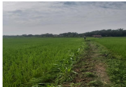
Gambar 4. Tanaman padi Milik KWT Anggrek

Sebelum melaksanakan program dan kegiatan maka tim pengabdian melakukan survei awal ke lokasi KWT Anggrek yang terdapat di Desa Selat untuk menginventarisasi semua permasalahan. Kemudian melakukan koordinasi dan sosialisasi secara partisipatif (Cirebon et al. 2023). Kegiatan pre tes dilakukan terlebih dahulu kepada anggota KWT untuk mengetahui tingkat pengetahuan dan keterampilan tentang eco farming berbasis tanaman padi dan itik untuk ekonomi kreatif. Post tes akan dilakukan setelah semua kegiatan berjalan sesuai dengan rencana.