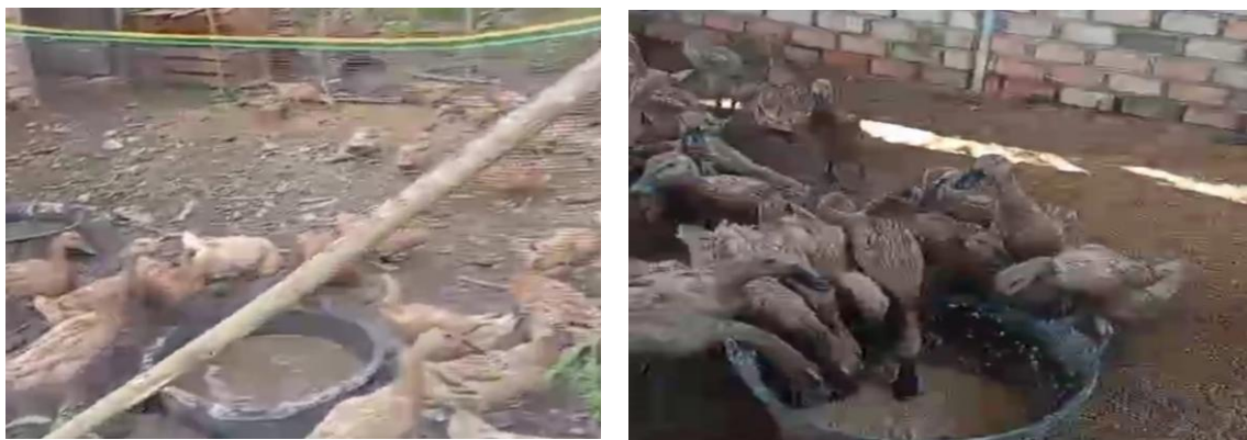
Gambar 7. Pemberian pakan diluar dan didalam kandang

Pemeliharaan itik dengan penerapan sistim Eco Farming memberikan manfaat yang sangat baik bagi KWT Anggrek terutama dalam menanggulangi hama padi seperti keong mas. Keong mas dapat dijadikan smber pakan tambahan bagi ternak itik dan ini tentu dapat mengurangi biaya pakan yang dikeluarkan.